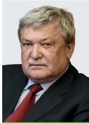
Dr. Csányi Sándor elnök-vezérigazgató