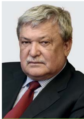
Dr. Csányi Sándor elnök-vezérigazgató

Dr. Csányi Sándor 1974-ben a Pénzügyi és Számviteli Főiskolán okleveles üzembizdász, 1980-ban a Marx Károly Közgazdaságtudományi Egyetemen okleveles közgazda diplomát szerzett. Pénzügy szakos közgazda, bejegyzett könyvvizsgáló. Az egyetem után a Pénzügyminisztérium Bevételi Főigazgatóságán, illetve a Pénzügyminisztérium Titkárságán dolgozott, majd 1983-tól 1986-ig osztályvezető volt a Mezőgazdasági és Élelmiszeripari Minisztériumban. 1986-tól 1989-ig a Magyar Hitel Bank Rt.-nél főosztályvezető. A K&H Bank vezérigazgató-helyettese 1989 és 1992 között. 1992-től az OTP Bank elnök-vezérigazgatója. Alelnöke a MOL Nyrt. Igazgatóságának, társelnöke a Vállalkozók és Munkáltatók Országos Szövetségének (VOSZ), valamint a Kínai-Magyar Üzleti Tanács társelnöke. Az MLSZ elnöke 2010 júliusától, 2015 márciusától az UEFA Végrehajtó Bizottságának tagja, 2019 februárjától az UEFA Végrehajtó Bizottságának alelnökének választották. 2017 áprilisától a FIFA Tanácsának tagja, 2018 februárjától a FIFA Tanácsának alelnöke. OTP többszörös tulajdona 2019. december 31-én 870.255 darab volt (közvetlen és közvetett tulajdonában lévő OTP részvények darabszáma 3.555.583).