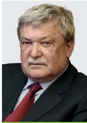
Dr. Csányi Sándor elnök-vezérigazgató